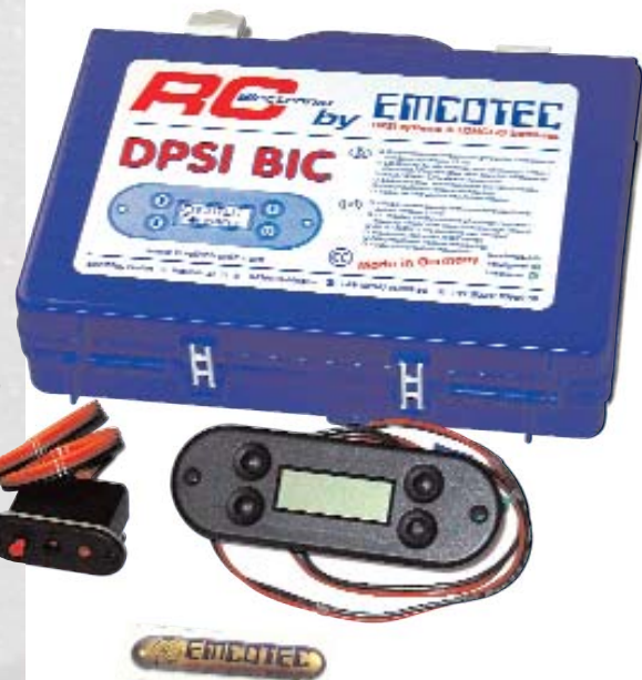
▲ Das DPSI Bic von Emcotec findet aufgrund seiner Größe auch im Rumpf kleinerer Modelle Platz.

Out-Spannung zeichnen ihn aus. Die Strombelastbarkeit des Power-MOSFET liegt weit über dem Wert, den Emcotec als Dauerstrom zulässt. Am Ausgang des Spannungsreglers ist ein 350-µF-Kondensator installiert, um Schwingneigungen zu unterbinden.